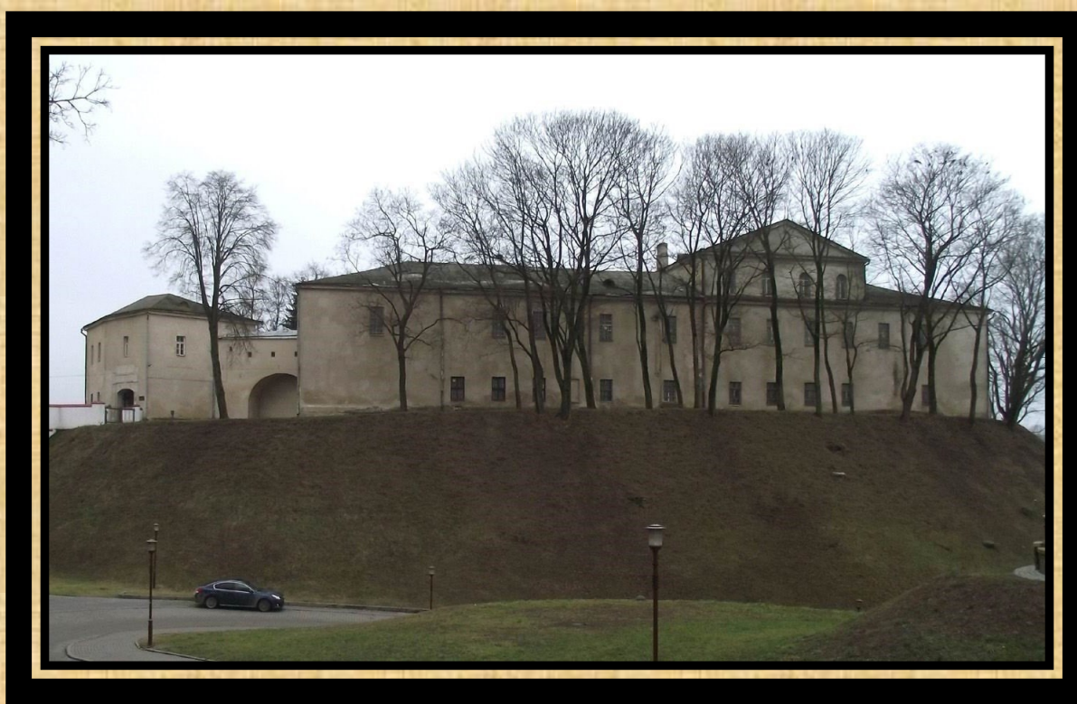
Stary Zamek w Grodnie

Po raz pierwszy zamek drewniany został zbudowany w XI wieku. W XIII wieku Grodno weszło w skład Wielkiego Księstwa Litewskiego. Od 1391 roku zamek był główną rezydencją księcia Witolda, który w 1398 roku zbudował kamienny gotycki zamek z pięcioma wieżami. Budynek ten w dużej mierze zachował się do dnia dzisiejszego.