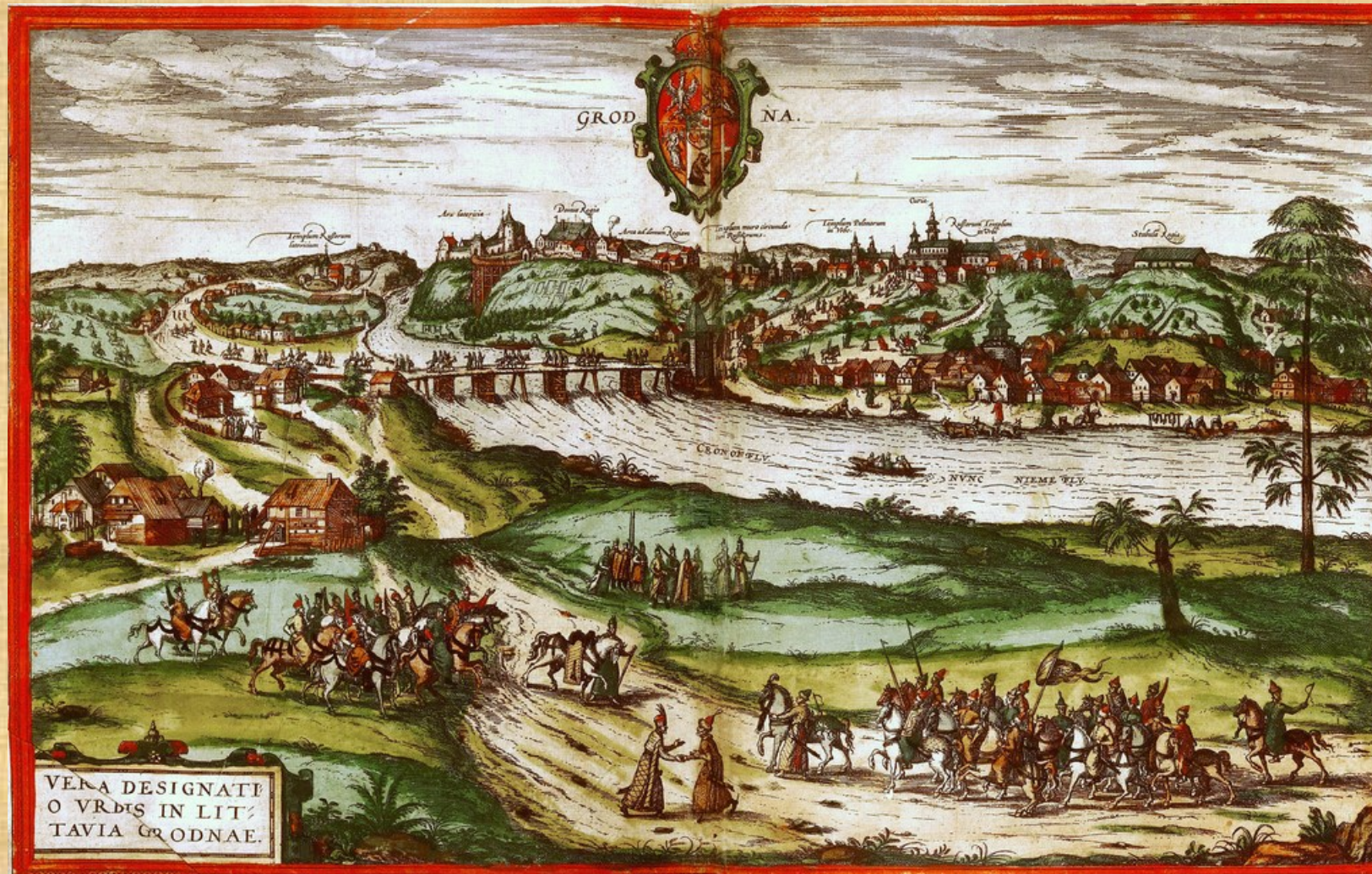
Grodno XVI wiek