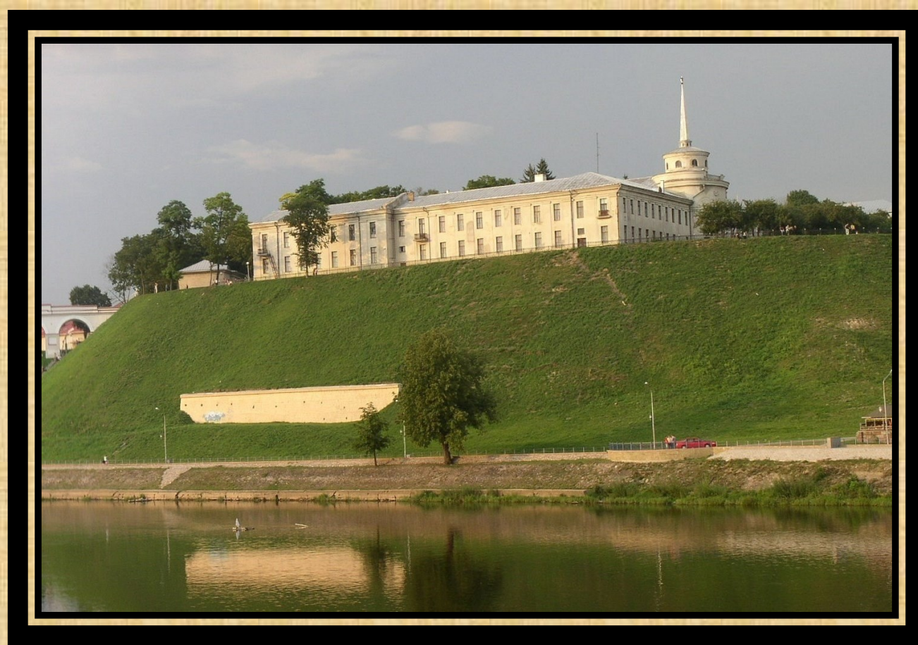
Nowy Zamek w Grodnie

Nowy pałac królewski, został wzniesiony w Grodnie w latach 1734-1751 za czasów panowania Augusta III, jako letnia rezydencja królów Polski.